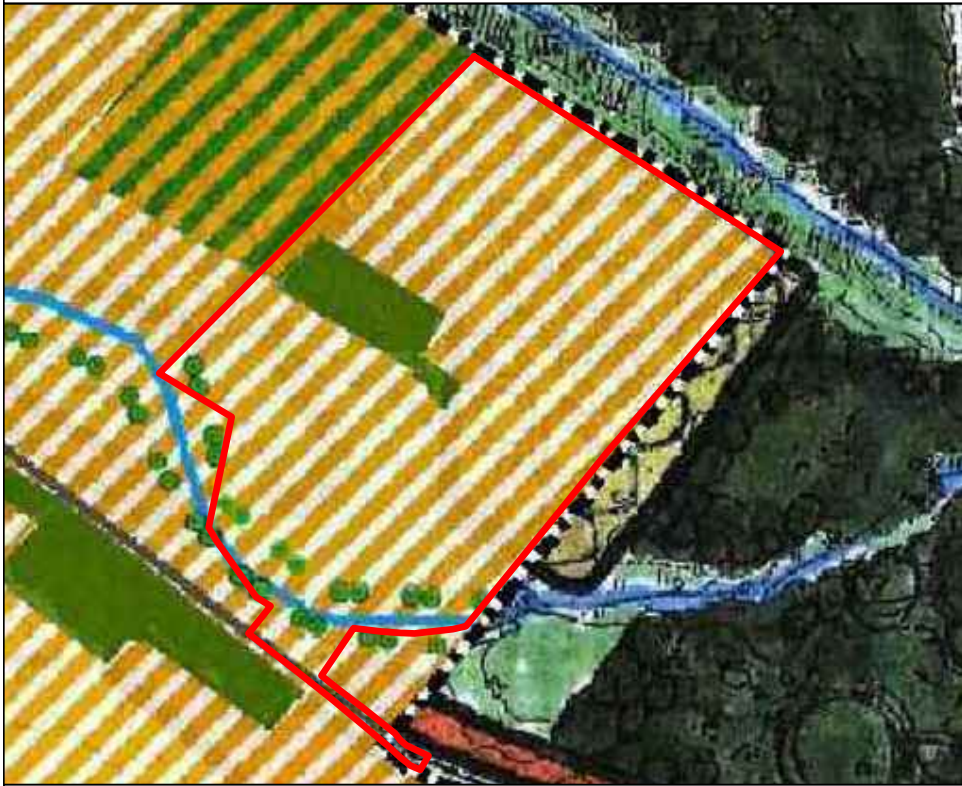
Wyrzys ze zmiany Studium uwarunkowań i kierunków zagospodarowania przestrzennego gminy Kaźmierz

ZALĄCZNIK NR 1 DO UCHWAŁY NR XLIV/285/17 RADY GMINY KAŻMIERZ Z DNIA 20 LISTOPADA 2017 R. OGŁOSZONEJ W DZIENNIKU URZĘDOWYM WOJEWÓDZTWA WIELKOPOLSKIEGO NR Z DNIA